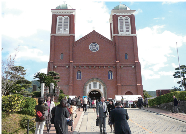
会場のカトリック浦上教会

2017 年はマルティン・ルター（1483～1546 年ドイツの修士・神学者）の宗教改革から 500 年となる大きな節目の年でした。このことを記念して昨年 11 月 23 日に長崎のカトリック浦上教会で