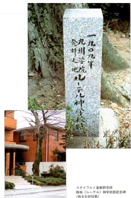
スタイワルト宣教師宅跡 「大江教会七十年史」より

その後 1925 年、諸事情により神学部は独立して東京都中野区鷺宮に移転、校名を日本ルーテル神学専門学校に変更。その後 1969 年に三鷹市へ再度移転して、現在は学校法人ルーテル学院（ルーテル学院大学、日本ルーテル神学校）となっています。