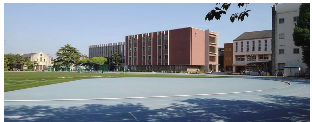
3月に竣工した中学校校舎(4号館)を旧体育館から望む