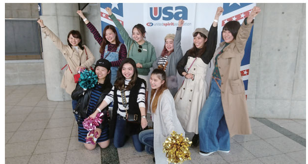
熊本・福岡・東京から駆けつけたチアOG

School & College Nationals 2018 全国大会（幕張メッセイベントホール）に出場しました。広い会場でミリアムズのキレのある演技。元気は他校を押し、満場に響く先輩 OG の応援が素晴らしい！