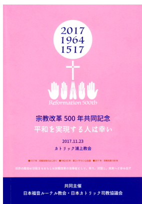
当日のプログラム

記念シンポジウムと礼拝が開催されました。この会は日本福音ルーテル教会と日本カトリック司教協議会との共催で行われたもので、歴史的なイベントとなりました。その内容については別の機会にご報告したいと思います。