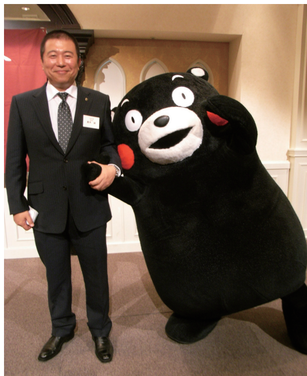
平成 24 年度会員総会にて

その KG 会も今年で 7 年目を迎え、お陰さまで本校はじめ PTA 等にもよろこんでいただけるまでに成