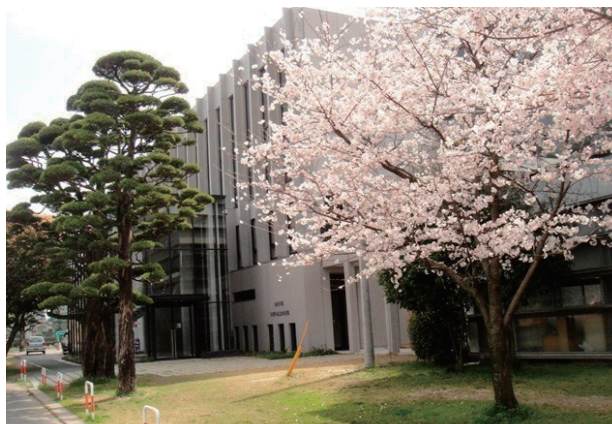
湧くや血潮は桜咲く

今、九州学院は高校、中学の卒業式を終え、新しい年度に向けて準備をはじめています。