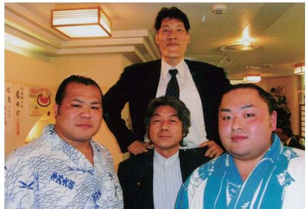
九学出 アスリート3人と‘あづま’にて