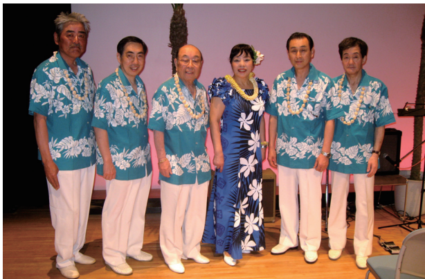
コロヘ今村&レイキングス