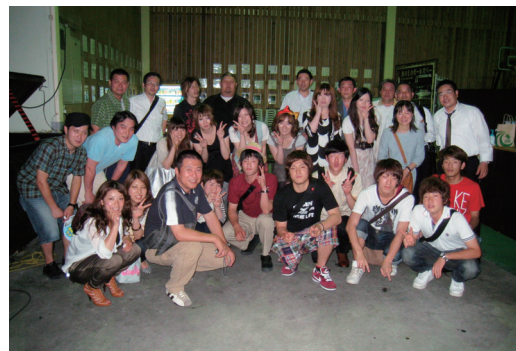
さあ行こう屋形船クルーズ