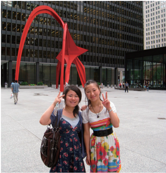
シカゴ連邦政府センター前 カルダー作“フラミンゴ”を背に.. (向かって右が私)

歴代大統領の顔が崖に彫ってあるものがみられるところなどに行き、今年はシアトル、ポートランド、グランドキャニオンやイエローストーン国立公園、ソルトレイクシティなどを回りました。旅先で見つけたキーホルダーとマグネットを集めているのでたくさん収集できました。