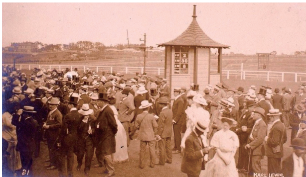
「根岸競馬場 最終日の賑わい」

日本レースクラブは1888年(明治21)から馬券を売り出し、賭金の手数料が収入となってクラブ財