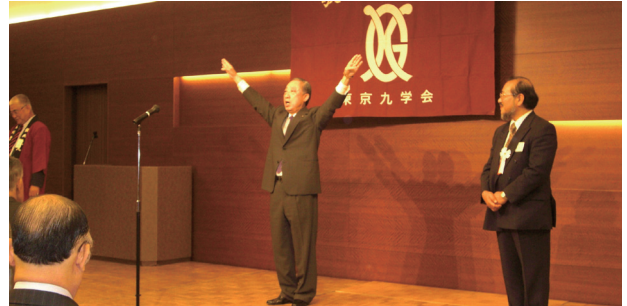
東京九学会総会・懇親会 九州学院校歌アー-

5月22日わが東京九学会の総会・懇親会は、旧制から新卒まで広い卒業年次にわたり楽しく、和やかに時が過ぎ、“我々は、本当にいい学校で学び、生涯の師と友を得たんだなー”と思わせる会でした。