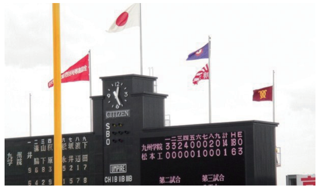
甲子園に揚がる校旗

今号も記事、広告寄稿ほか多くの方のご協力を頂き発行することが出来ました。有難うございました。