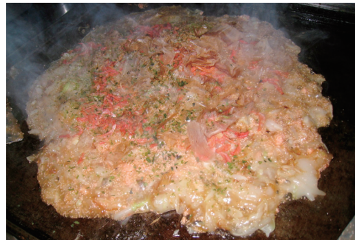
屋形船の MIX もんじゃ

7月16日金曜の夕方、新木場から発の屋形船もんじゃ焼きを開催しました。参加者は約 30 名でそのうち新卒者9名、学生11名でした。食べ飲み放題で、メニューには普通の MIX もんじゃに、タイ風カレーもんじゃ、デザートもんじゃ、お好み焼き、焼きそばがありました。自分たちで焼いて食べるので 2 時間もあっというまに過ぎてしまいました。あと船のゆれのせい、暑さのせい、お酒の酔いがいつもより早かったような気がします。焼くことと食べることに集中しがちですが、外を見るとお台場のフジテレビやレインボーブリッジなどの夜景もとても綺麗でした。去年に引き続き二回目の開催となりましたが、毎回好評でしたので毎年恒例にできればと思っています。今回は他のお客様もいらっしゃいましたが、次回は船を貸しきりにできればよいなと思っています。また皆様のご参加お待ちしております。