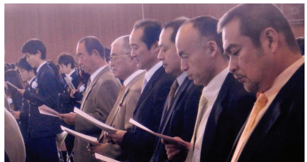
卒業 50 年生：“むつびの鎖は とくる時なし”

それから、東京九学会のメディアとして、既設の東京九学会ホームページと、本東九通信(年2回発行)を併用致します。リアルタイムのやり取りを必要とするものは前者の会員広場へ、時間をかけてよいものは、後者 本通信へ奮ってご発表、ご投稿下さい。若手の会「KG会」のホームページも充実しております。併せこちらもご覧下さい。 本年も、東京九学会活動に会員みなさんのご協力を宜しくお願い致します。