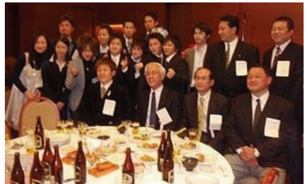
11月22日KG会のテーブル

ても50名近くの生徒たちが関東地方の大学や短大に進学しています。熊本県ではこんな高校はあまりないのでと常々思ってきました。その内の何パーセントぐらいが関東地方に残るのかは不明ですが、われわれ地方都市に住む者の目から見たら、ちょっと気を抜くと都会の喧騒の中に埋もれてしまいそうな大都市の中で、自己のアイデンティティを保持するのはそう容易なことではないのではとよく思うことがあります。